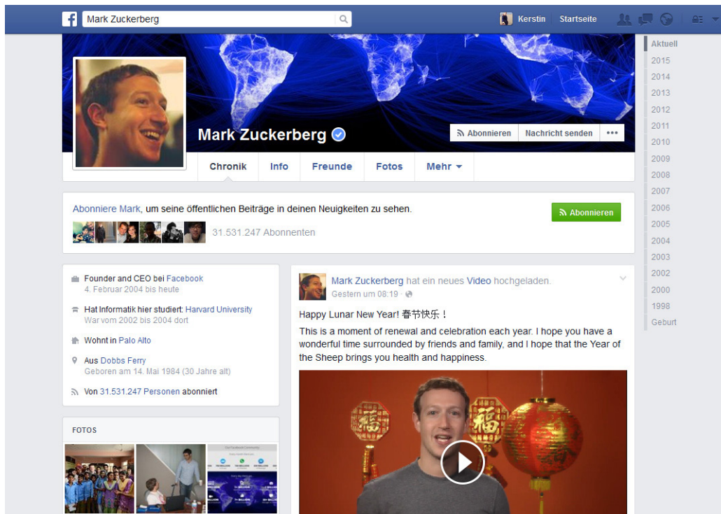
Abb. 3: Profilsseite von Mark Zuckerberg.