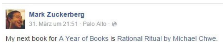
Abb. 1: Screenshot von der Facebook -Seite des Unternehmensgründers Mark Zuckerberg.

Die ›Startseite‹ bei Facebook , also jener Newsfeed, auf dem Facebook -User die Posts ihrer ›Freunde‹ lesen können, erscheint zunächst als ein Salon, ähnlich wie bei Fontane. ›Vielstimmigkeit‹, wie sie bei Fontane auftritt, scheint dabei fast eine Untertreibung zu sein. Eine Zahl von hunderten ›Freunden‹ 48 ist nicht außergewöhnlich auf Facebook , so dass im Regelfall eine Vielzahl von Posts im Newsfeed erscheinen, die ihrerseits wieder kommentiert werden können. Dabei wird eine Gesprächssituation durch die Verbindung von Profilbild und Post inszeniert, so dass letzterer als eine Äußerung des im Profilbild Abgebildeten 49 verstanden werden soll.