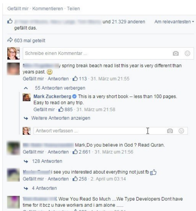
Abb. 2: Screenshot von Kommentaren unter einem Post.

Kommentar mit der Aufforderung »Schreibe einen Kommentar« erscheint. Die ›Startseite‹ kann also durchaus als eine radikalisierte Version von Fontanes Salon-Chronotopos gesehen werden.